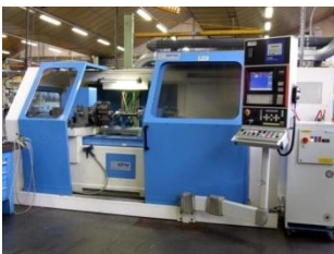
Rénovation et numérisation de vieilles machines