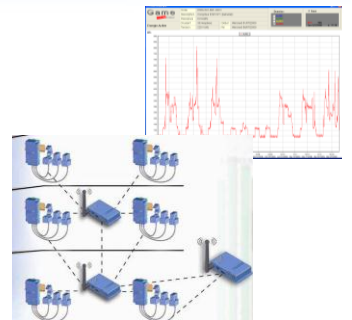
Analyse de la consommation énergétique des machines en fonctionnement WIFI