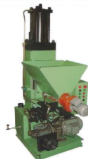
Valorisation des copeaux, des boues et des huiles de coupe par compactage